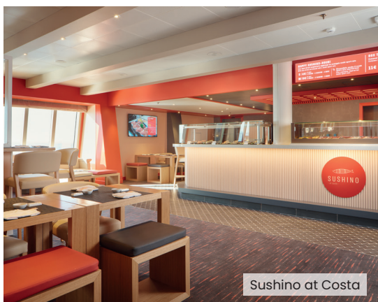
Sushino at Costa

EN SAVOIR PLUS Scannez le code QR et accédez à la page web